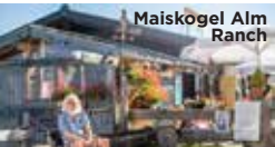
Maiskogel Alm Ranch